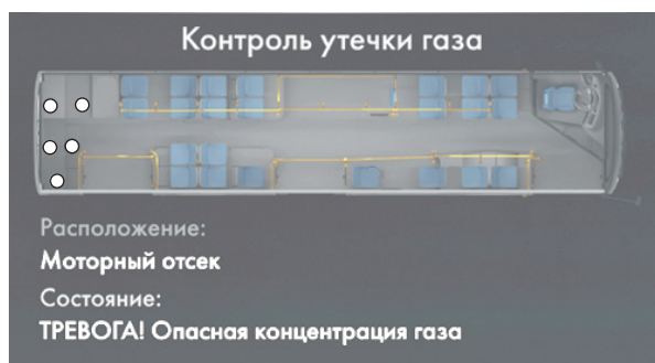
Экран «Контроль утечки газа»

На данном экране отображается состояние датчиков контроля утечки газа. При обнаружении утечки отображается название отсека и состояние датчика, при наличии сигналов из более чем одного отсека, они будут переключаться автоматически. Для перехода к ручному выбору отсека необходимо воспользоваться клавишами «ВВЕРХ» или «ВНИЗ» на панели переключателей.